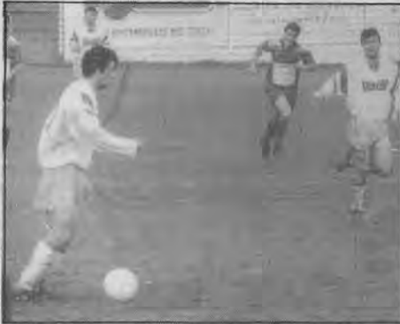
Sutil volvió a ser el del inicio de liga y consiguió dos goles.

INCIDENCIAS: La directiva a instancias del